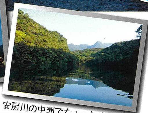
安房川の中洲でちょっと上陸休憩