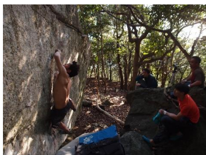
木々に囲まれた山エリア